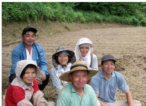
こまめ倶楽部の皆さん!

※今回の宿泊は、畑近くの集会所を予約しました。 皆さんでごろ寝になりますがお了承ください。